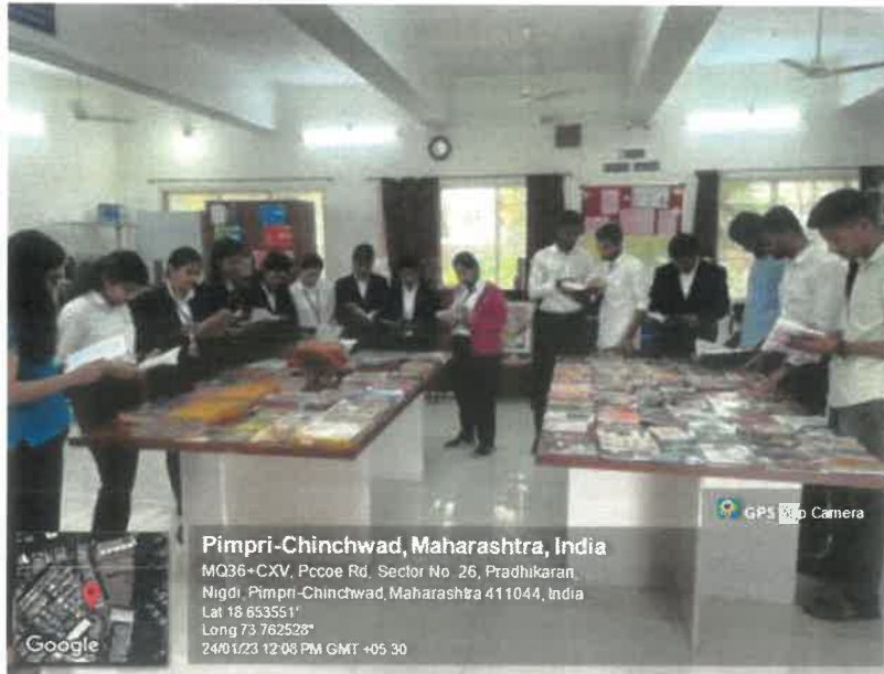
Marathi book Exhibition in the Library