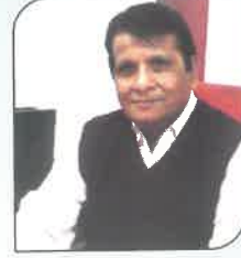
स्व. श्री. भाईजान काझी विवस्वत - पि. चि. एज्यु. ट्रस्ट